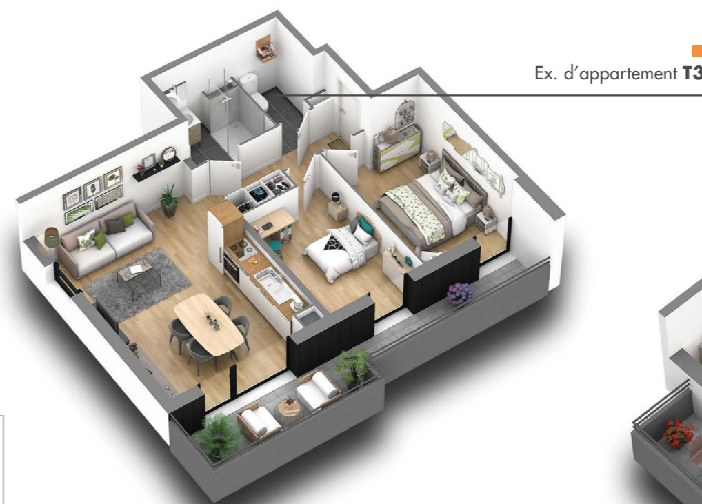
Ex. d'appartement T3